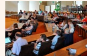
Auftakt im Plenum

Über 80 Interessierte nahmen am 20. Juni 2013 im Kreishaus in Detmold an dem Workshop „Lebendig – anschaulich – konkret: Lernen am außerschulischen Lernort“ teil. Veranstalter waren die Arbeitsstelle „Kulturelle Bildung in Schule und Jugendarbeit