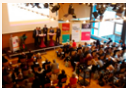
Tagungsplenum: Gesprächsrunde mit Experten

innen, Akteure aus Schule und Kultur, Multiplikator/innen und Praktiker/innen aus Jugend-, Sozial- und Kulturarbeit sowie aus Kommunen. Schulministerin Sylvia Löhrmann erklärte im Vorfeld der Veranstaltung: „Kulturelle Bildung bietet für alle Kinder und Jugendlichen die Chance, ihre Stärken zu entdecken. Sie schafft Freiräume