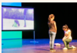
Theaterspiel in der Jugendarbeit