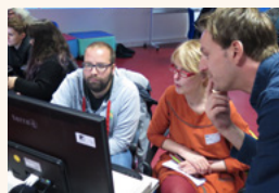
Workshop „Making the Game“

Am 04. November 2015 fand im Kreishaus Olpe der Fachtag „Raus aus der Schule – Lernen am anderen Ort“ statt. Der Fachtag informierte über die Möglichkeiten des Lernens an anderen Orten und präsentierte Beispiele gelungener Zusammenarbeit zwischen Schulen und außerschulischen Lernorten. Zudem informierte er über die „Pädagogische Landkarte“, einem Internetportal mit Informationen über außerschulische Lernorte. Etwa fünfzig Interessierte nahmen an der Veranstaltung teil. Veranstalter waren das LWL-Medienzentrum für Westfalen, der Kreis Olpe und die Arbeitsstelle Kulturelle Bildung NRW. Weitere Informationen erhalten Sie auf unserer Website unter www.kulturellebildung-nrw.de .